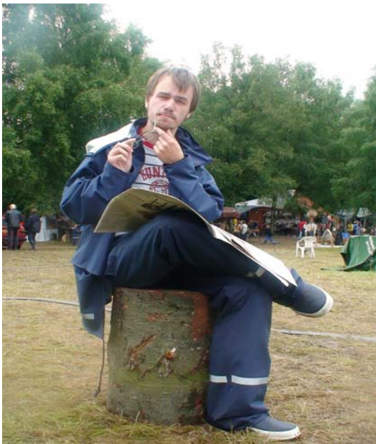
Birk, 19 år, klog

ste menneske: "Ældre mennesker har mere erfaring, men til gengæld glemmer de hurtigt", siger han. Det er altså ungdommen vi skal satse på: "Mennesket bliver klogere og klogere, derfor skulle vi ger-