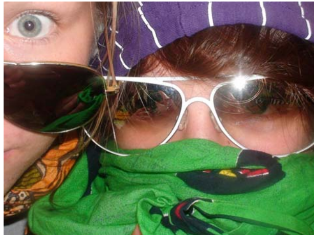
De fabelagtige hjerner

I dag er dagen hvor vi, redaktionens unge stjernestøv, tager over. Vi mener simpelthen at avisen er for useriøs, Kit, avisens redaktør, er forældet og noget nyt er nødvendigt for at skabe en succesfuld avis. Derfor vil vi i dag komme med de hårde facts fra lejren og omverden. I dag skal I lære noget! Er det ikke også derfor I er kommet her? Det er den 25ende lejr, og det er på tide at stoppe pjatteriet og